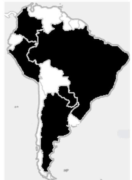
América do Sul Amostra de países

39. De la même manière, on peut observer que, pour un ensemble significatif de pays, la terre continue d'être un des actifs présentant une concentration élevée de la propriété, comme on peut le constater à l'aide des données du Recensement agricole mondial de 1990, élaboré par la FAO. En ajoutant les données de quelques pays, il est possible d'avoir un cadre de la répartition des terres dans les continents. 11