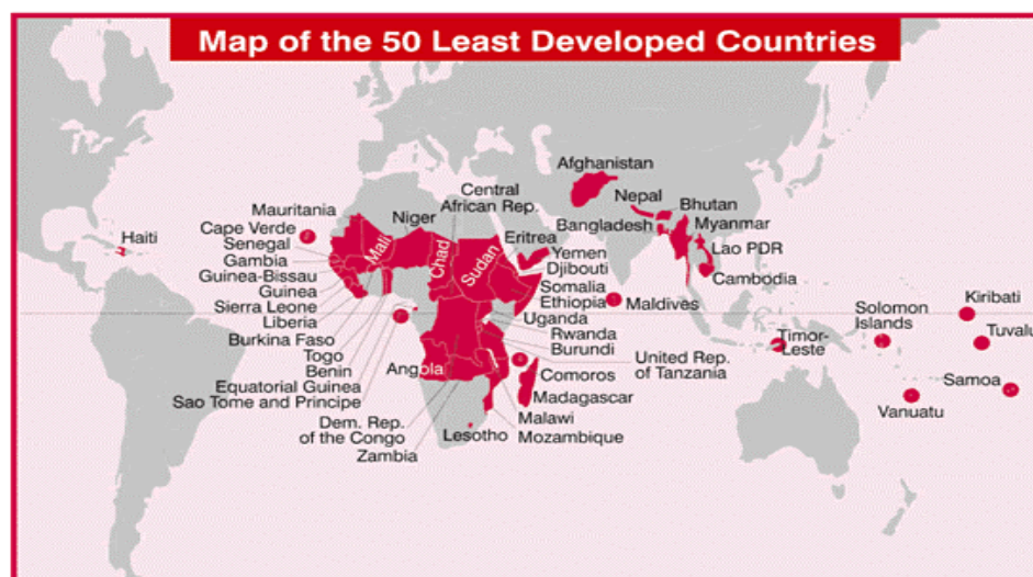
(1) FIGURE 1

35. Dans les pays les plus pauvres de l'Afrique – qui inclut 34 des 49 pays les plus pauvres du monde – presque 9 personnes sur 10 vivent avec moins de deux dollars par jour, consommant en moyenne 86 cents par jour alors qu'aux Etats Unis, ce nombre s'élève, per capita , à 41 dollars par jour. Dans ces 34 pays africains, de la seconde moitié des années 70 jusqu'à la seconde moitié des années 90, la proportion de personnes qui gagnent moins de 1 dollar par jour est passée de 56% à 65%, toujours selon la UNCTAD.