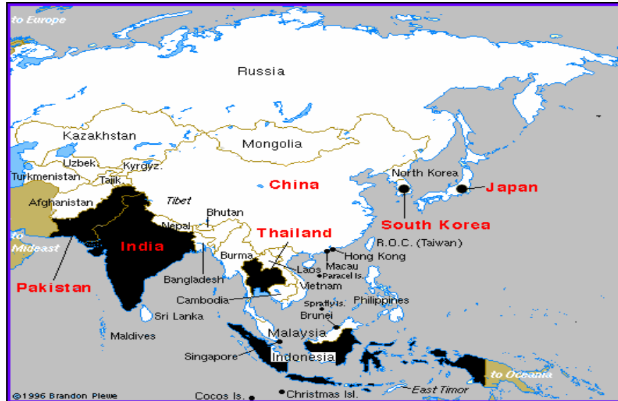
Cuadro 3: Estructura agraria de Asia (India, Indonesia, Pakistán y Tailandia)